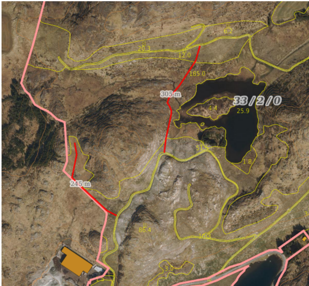
Figur 1 viser trasé 1 i vest er redusert fra 444 til 245 meter. Trasé 2 i øst er endret og redusert fra 358 til 305 meter.

Du opplyste at du ville bruke hulldekke i betong ved kryssing av bekkeløp. At det ikke skulle utføres noe fysisk inngrep i bekkeløpet. Det ble enighet om at det skulle sendes nytt kart. Nytt kart ble mottatt 10.04.2024.