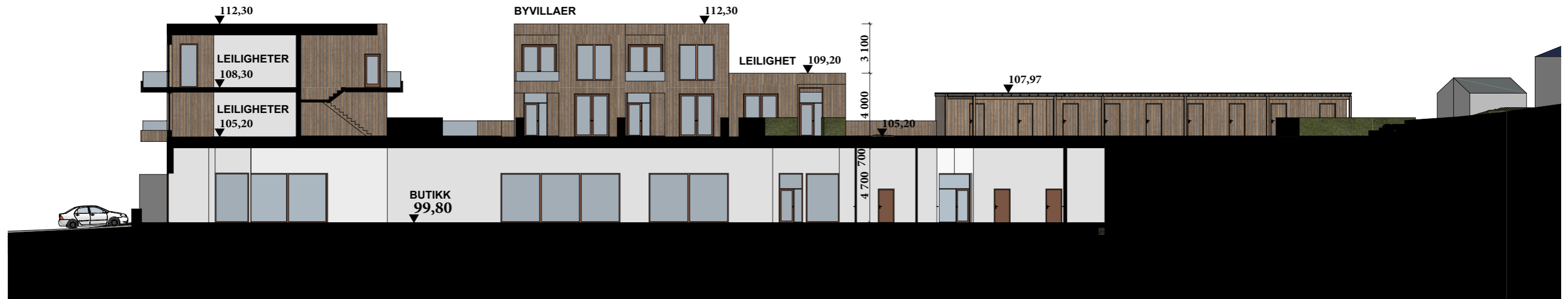
Snitt A - A